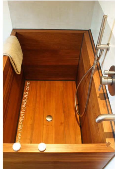
Baignoire 1 personne profonde style Japonaise sans dossier ni banc - Teck massif