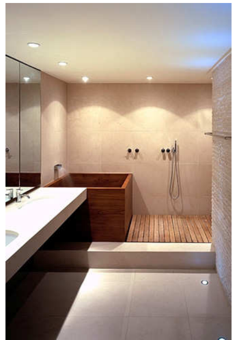
Baignoire profonde 2 personnes Sandwich Teck