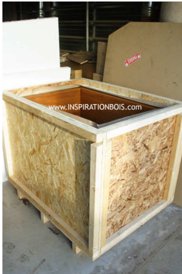
Bain profond 1 place en caisse de transport palettisée

Nous fabriquons une caisse de transport pour cela, également utile à réception si les travaux dans la pièce destinée à recevoir la baignoire ne sont pas terminés, celle-ci devant alors rester protégée.