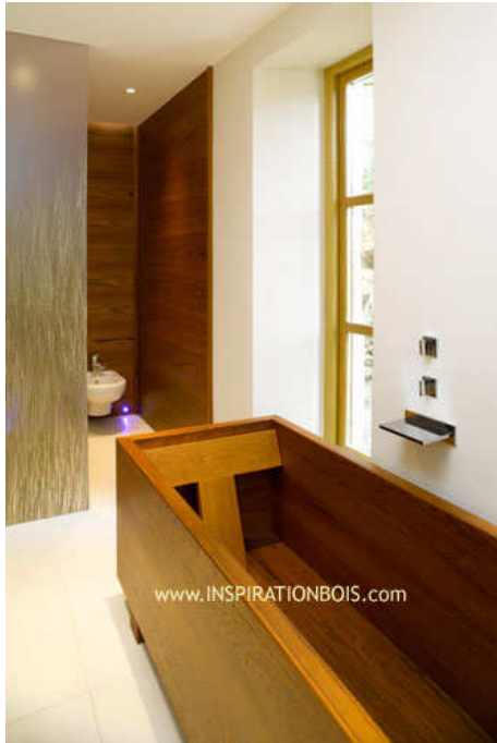
Baignoire 1 personne avec dossier en Té Sandwich Teck

L'Ebéniste d'Eau - mobilier et agencements sur mesure