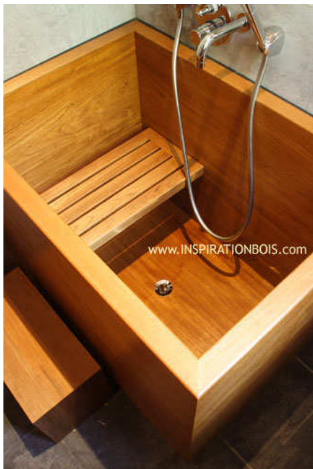
Baignoire profonde 1 personne avec banc amovible Tabouret d'entrée - Sandwich Teck