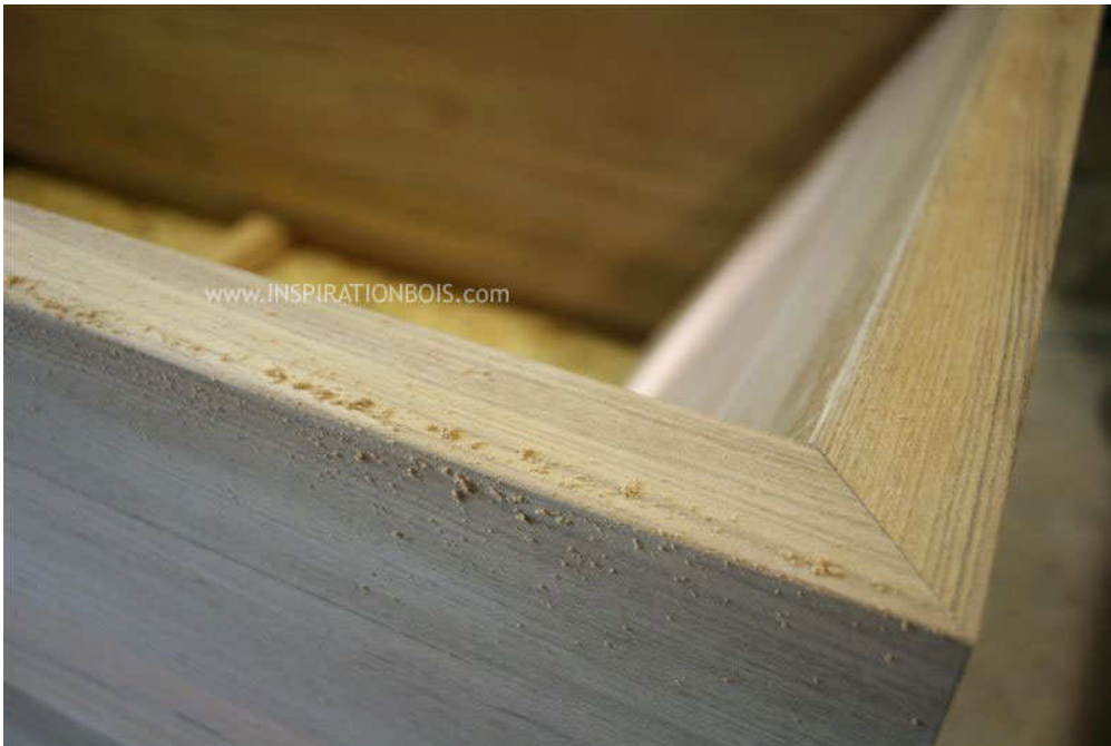
Détail d'angle d'une baignoire en Teck massif en cours de fabrication