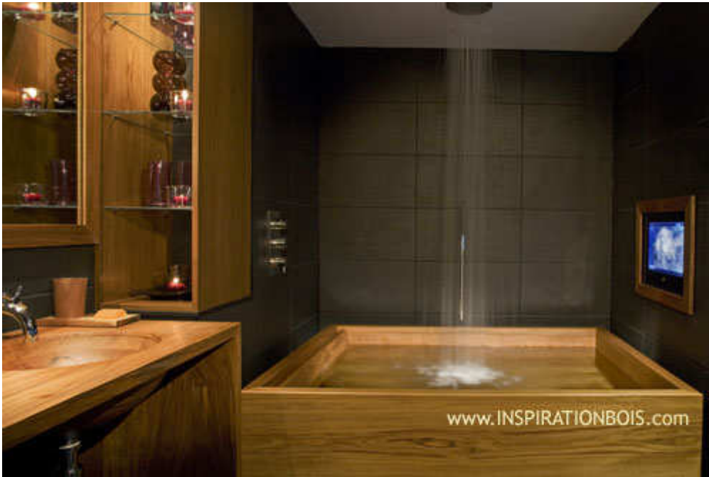
Grande baignoire carrée 150 x 150cm - deux places côte-à-côte - Sandwich Teck

L'Ebéniste d'Eau - mobilier et agencements sur mesure